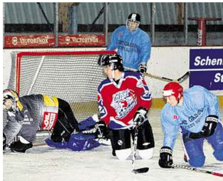
Chämloch-Turbulenzen: Freund und Feind sind am Boden, und keiner weiss, wo die Scheibe ist.

Turnierzeiten (durchgehend): Freitag 18.30 bis 01.00 Uhr; Samstag 08.00 bis 01.00 Uhr; Sonntag 08.00 bis 16.00 Uhr.